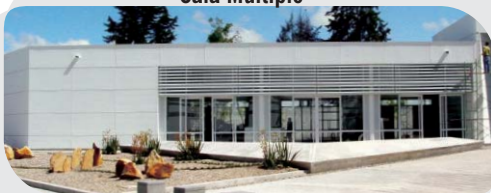
Aislamiento interno para puertas de acceso