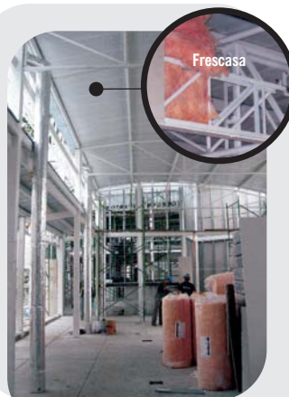
Aislamiento interno termoacústico tipo sandwich para cubierta metálica en la zona de oficinas y sala múltiple