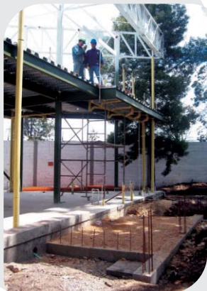
Estructura metálica Entrepiso en metaldeck Cañuelas con recubrimiento para bajantes de aguas lluvias y sanitarias