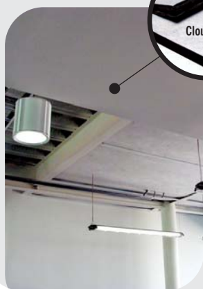
Cielo raso acústico en el área de oficinas