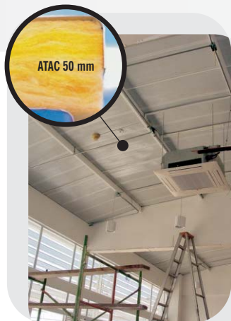
Cubierta Metálica tipo sandwich ATAC 50 mm Bandeja perforada