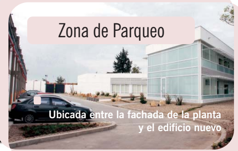
Zona de Parqueo