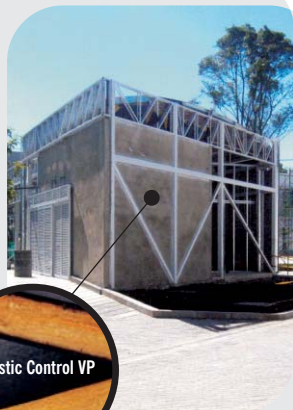
Aislamiento interno termoacústico para muros de fachada en fibrocemento