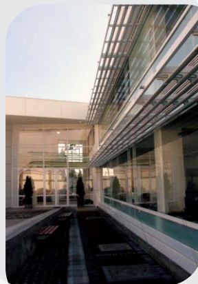
Diseño bioclimático y acústico según los requerimientos de cada espacio y del clima durante el año